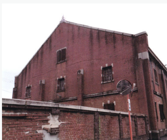
現存する広島陸軍被服支廠(ひふくししょう)の建物

おもっているおもっている つぎつぎと動かなくなる 同類のあいだにはさまって おもっている かつて娘だった にんげんのむすめだった日を